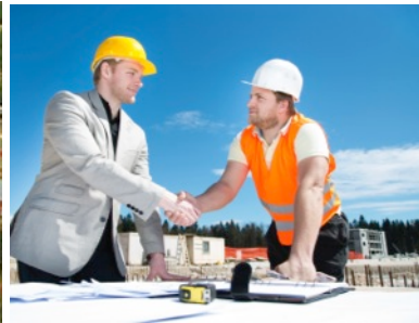
PRT-Pro™ (Pyhännän Rakennustuote)